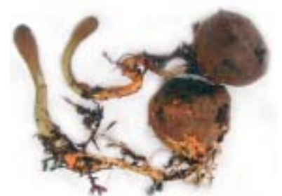
le Cordyceps sinensis

En résumé, des suppléments de ginseng peuvent augmenter les performances physiques et mentales s'ils sont pris assez longtemps et à des doses suffisantes. Le ginseng peut avoir des bénéfices plus grands pour les personnes non entraînées ou plus âgées (> 40 ans). Le ginseng ne semble pas manifester des effets aigus sur la performance physique. En général, les suppléments de ginseng sont sûrs, bien que la variabilité individuelle existe et que la potentialisation avec des stimulants comme la caféine semble déconseillée. Un autre adaptogène qui affecte positivement la capacité aérobie est un champignon : le Cordyceps sinensis . Talbott et ses collègues ont examiné le cordyceps sur 12 semaines avec 110 sujets sédentaires. Les résultats ont indiqué une augmentation du pic de captation d'oxygène de 5,5 %, un total de capacité de travail supérieur de 2,8 % et une diminution de la fatigue. D'autres recherches semblent nécessaires pour comprendre les mécanismes d'actions potentiels du cordyceps.